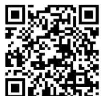
写真 アップロード手順