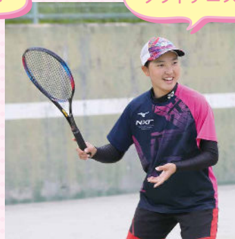
● 令和4年度宮城県中学校体育大会ソフトテニス競技個人戦ベスト16 ● 第38回宮城県中学校選抜ソフトテニス大会 出場