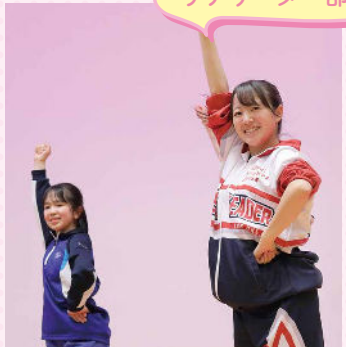
● イーグルス ガールズデー 出演 ● マイナビ仙台レディスチアフェスティバル 出演